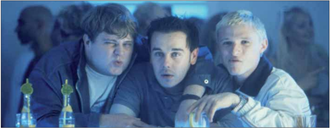
»Absolute Giganten« (X Filme Creative Pool)

Am Sonntag, den 24. April, gibt es eine ungewöhnliche Kinotour in der Hansestadt: In der ersten gemeinsamen Veranstaltung der Hamburger Arthouse-, Programm- und Offkinos zeigen 14 Häuser Sebastian Schippers Kultfilm Absolute Giganten von 1999 einen ganzen Tag lang mit Rahmenprogramm: Kickerturnier, Mini-Elvis-Show, Fotoausstellung zum Hafen, Filmquiz, Filmbingo und einer kleinen Retro zum früh verstorbenen Hauptdarsteller Frank Giering (Details und die Aufführungstermine in den einzelnen Kinos unter www.einestadt-sieht-einen-film.de ).