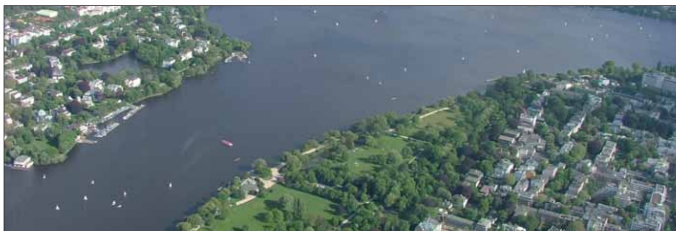
Fokus Alstervillen, 2004

Und schließlich die schon etwas ältere SKA zu den »Auswirkungen der Wohngeldreform« (Drs. 21/3466 vom 8.3.2016) . Hintergrund ist der nicht unwesentliche Umstand, dass durch die zum 1. Januar 2016 gültig werdende Wohngeldreform bundesweit rund 320.000 Haushalte erstmals oder wieder wohngeldberechtigt sind (nachdem die Wohngeldreform über Jahre verschleppt worden war). Kein Pappentiel also, sichert das Wohngeld als Subjektförderung doch die Wohnung bei so manchem geringverdienenden Haushalt. Die Gesetzesnovelle hat laut Senats- bzw. Fachbehördenauskunft immerhin etwa »eine Verdopplung der Anzahl der Wohngeldhaushalte in Hamburg« zur Folge – im Dezember 2015 bezogen in Hamburg genau 8.544 Haushalte Wohngeld. Und was unternimmt die Behörde, um die Anspruchsberechtigten über diese Veränderungen ins Bild zu setzen? Informiert wurden zunächst die im Wohngeldbezug stehenden Haushalte. Okay, aber die bekommen seit dem 1. Januar natürlich automatisch die höheren Wohngeldzuweisungen. Im Einzelfall wird zudem beraten, wer zu einem der bezirklichen Fachämter für Grundsicherung und Soziales kam bzw.