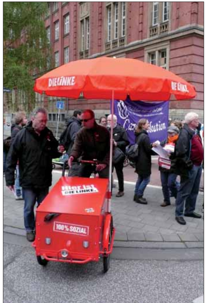
Linke auf der Straße: 1. Mai 2015