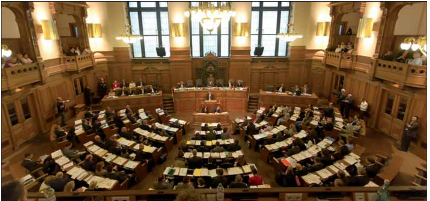
Das Plenum ist nicht alles: Bürgerschaftssitzung, 19.3.2012