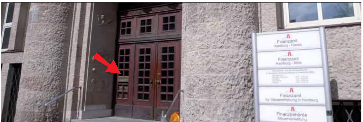
Steuern: der richtige Briefkasten

Die Anwaltskanzlei Mossack Fonseca in Panama steht im Mittelpunkt eines Skandals um Briefkastenfirmen, die die Kanzlei für Tausende Kunden eingerichtet hat. Die Datensätze der