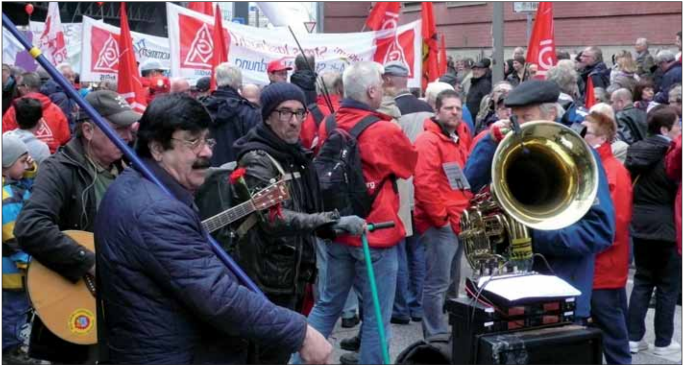
Hier und folgende Seite: 1. Mai 2015 in Hamburg

Für DIE LINKE ist die Unterstützung der Demonstration und Kundgebung des DGB zum 1. Mai natürlich ein Muss. Das ist nicht nur der Tradition der ArbeiterInnenbewegung geschuldet, es hat auch den Hintergrund, dass ohne die Gewerkschaften größere Veränderungen in der Bundesrepublik nicht zu haben sein werden. Also nehmen wir uns »Zeit für mehr Solidarität«, so der Slogan des DGB-Maiaufrufs, den wir weiter unten dokumentieren.