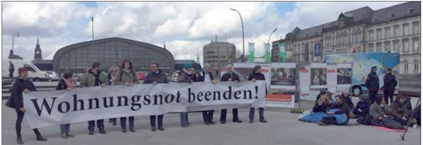
Demo am 31.3.2016