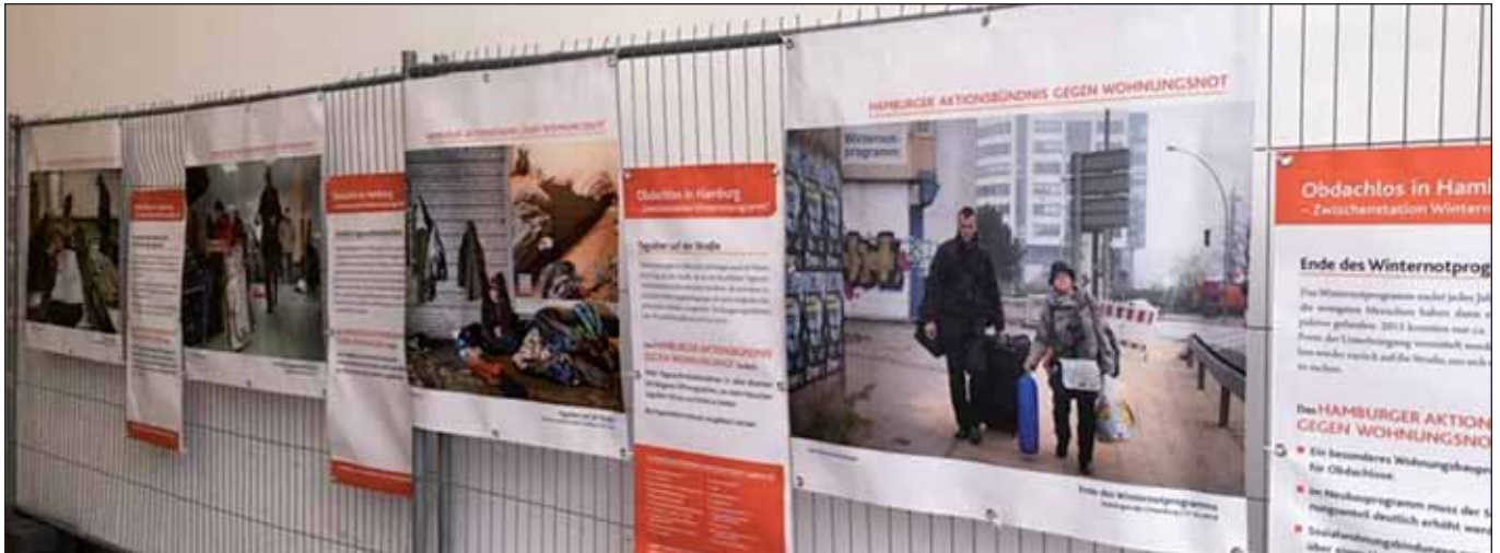
Fotoausstellung »Obdachlos in Hamburg ...« (B. Reuter)

lich geförderten Wohnungen ausschließlich wieder an den gesetzlich vorgesehenen Personenkreis, also Menschen mit geringem Einkommen, vergeben werden.