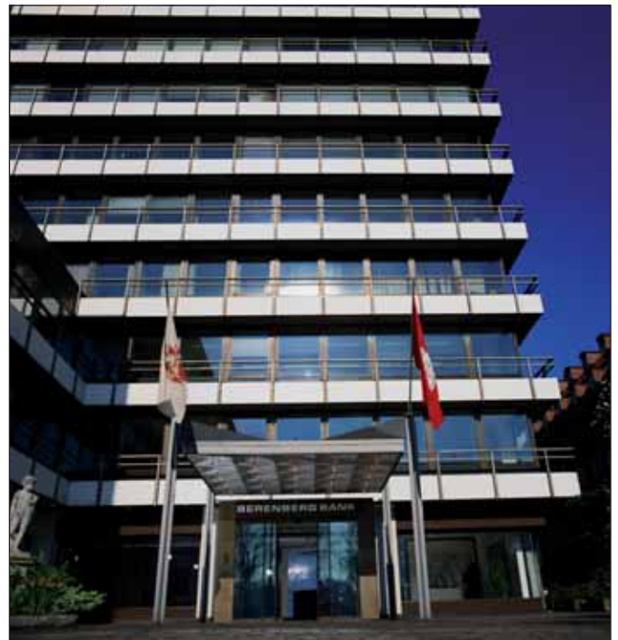
»Spitzeninstitut: Berenberg-Bank Hamburg, 2009

Panama zählt zu den weltweit größten Anbietern von Offshore-Gesellschaften. Über einen Zeitraum von fast 40 Jahren soll Mossack Fonseca (MF) rund 215.000 anonyme Gesellschaften in 21 Rechtsräumen für über 14.000 KundInnen aufgesetzt haben. Mehr als die Hälfte der Offshore-Gesellschaften, hinter denen kein wirklicher Geschäftsbetrieb steht, sondern nur eine Briefadresse zur Verschleierung von Vermögensverhältnissen, sind auf den Britischen Jungferninseln beheimatet, fast 50.000 in Panama. Ganz offensichtlich war das