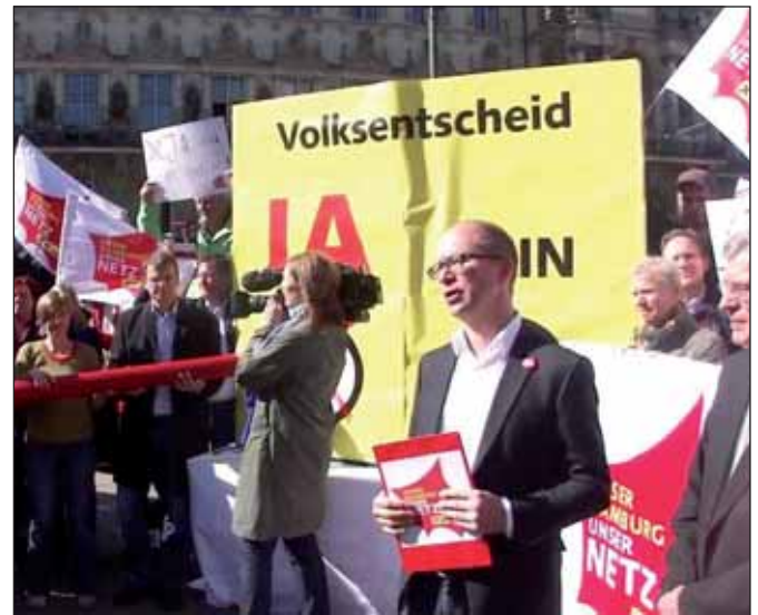
»Unser Hamburg – Unser Netz«, Rathausmarkt, 19.9.2013

Jedenfalls hat sich in Reaktion auf das »Bürgerschaftsreferendum« eine Volksinitiative »Rettet den Volksentscheid« auf