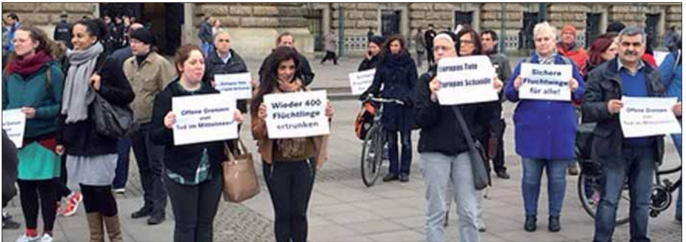
Rathausmarkt-Flashmob, 17.4.2016

In diesen Tagen gibt es nicht viel Gutes aus dem Bereich Flüchtlingspolitik zu berichten. Während wir aus der Ferne ZeugInnen der rechtswidrigen Zurückschiebungen Geflüchteter von Griechenland in die Türkei werden und Tausende in Idomeni für ihre Weiterreise kämpfen, hat der Bundestag eine Asylrechtsverschärfung nach der nächsten im Eilverfahren beschlossen und weitere sind in Planung. Hier wie dort werden massiv Rechte Geflüchteter missachtet und Standards geschliffen. Die Grundlage dafür schaffen die AfD und andere Flüchtlingsfeinde, die weite Teile des Diskurses mit einer absolut inhumanen und rassistisch aufgeladenen Rhetorik dominieren.