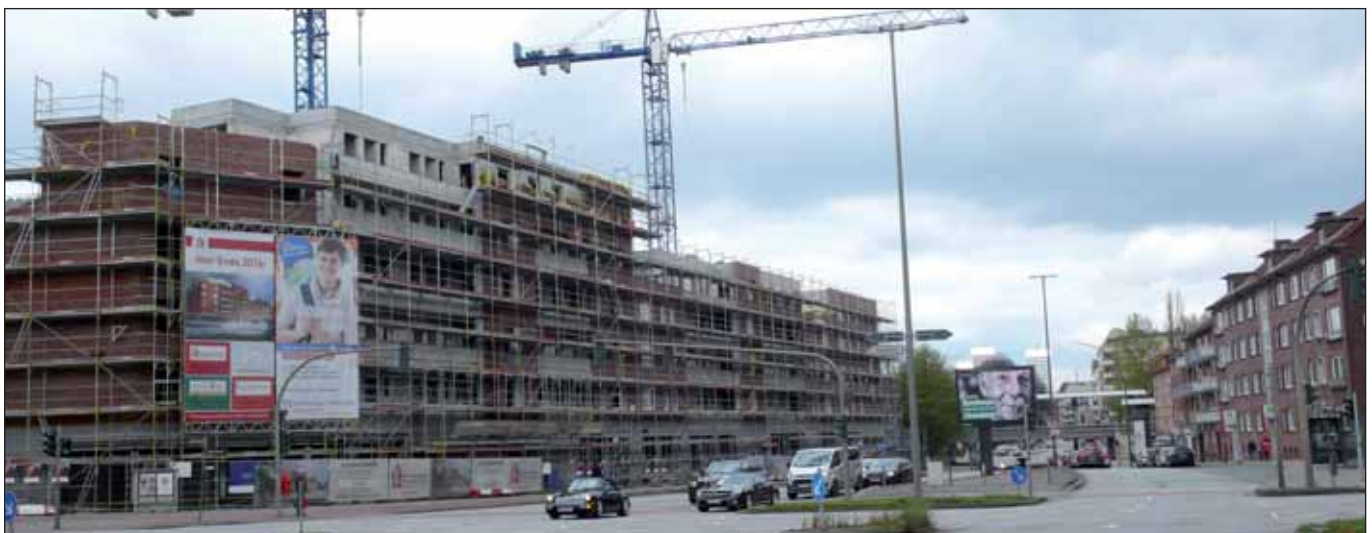
Verkehrsgünstig... &amp; gefördert: »Landwehrhöfen« (M. Fisch)