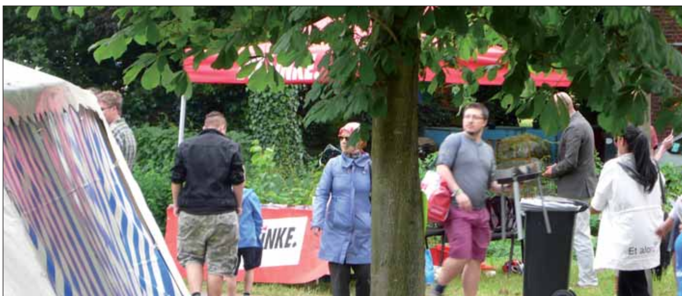
Stadtfest in Horn, 6.6.2015

ohne allzu viele Illusionen über den Gesamttrend in Deutschland zu nähren, sei uns an dieser Stelle doch einmal ein gewisses Maß an Zufriedenheit gegönnt. Nach einer repräsentativen Infratest-Wahlumfrage im Auftrag des NDR Anfang April würde die SPD aktuell zwar 6,6% verlieren (39%), die GRÜNEN aber – wofür auch immer – um 2,1% zulegen (15%) und damit die Mehrheit für die amtierende Senatskoalition sichern. Auch die CDU gewänne 2,1% (18%), wenigstens die FDP würde um 1,4% absacken (6%). Leider legt die AfD laut Umfrageergebnis um 1,9% zu, bliebe aber mit ihren gegenwärtigen 8% in Hamburg meilenweit hinter ihren ostdeutschen Werten zurück.